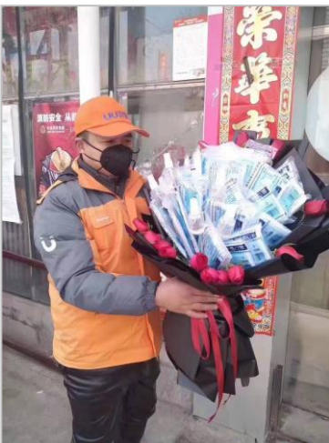
Masken zum Valentinstag in China

Die Erklärungen kamen prompt: Bis zu diesen neuen Zahlen wurde ein Fall nur dann in die Statistik aufgenommen, wenn mit einem aufwendigen, teuren Test Viren in der Lunge nachgewiesen wurden. Alle anderen klinischen Verfahren wurden bisher nicht als ausreichend bewertet. Jetzt aber wurden auch die mit anderen Untersuchungsmethoden ermittelten Fälle aufgenommen, auch die also, an denen nicht der aufwendige Test durchgeführt wurde.