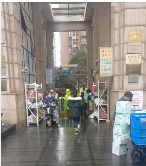
Sammelstelle für Lebensmittel

Lebensmittel werden von den umliegenden Shops auf ähnlichem Weg angeliefert und vor dem Wohngebiet in eigens bereit gestellten Regalen abgeliefert.